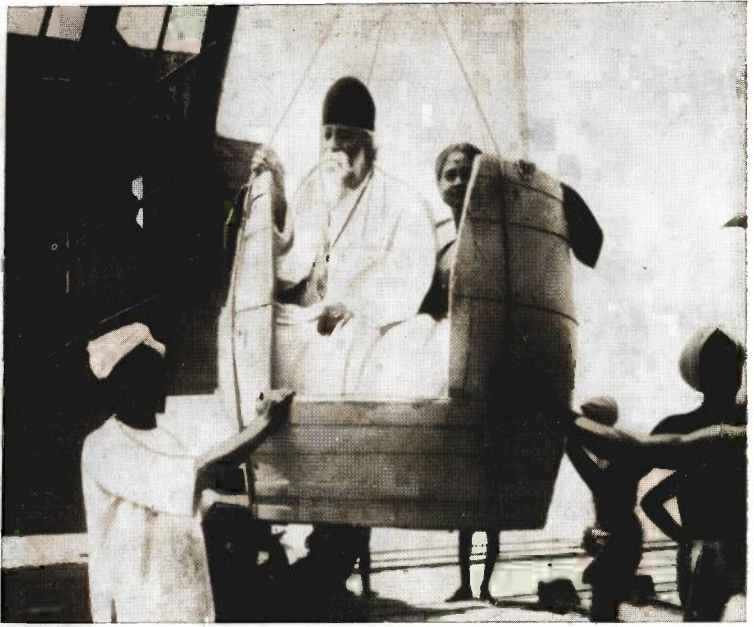
পিপের মধ্যে রবীন্দ্রনাথ