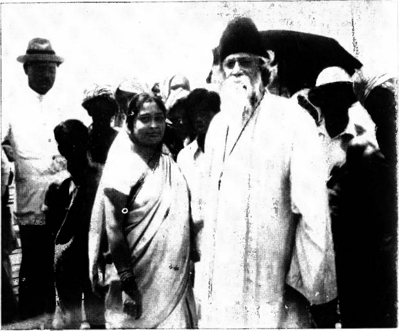
কলম্বোর জাহাজঘাটে রবীন্দ্রনাথ