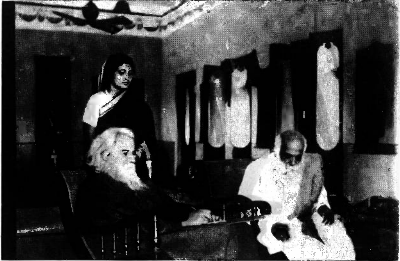
আচার্য ব্রজেন্দ্রনাথ শীল, রবীন্দ্রনাথ ও লেখিকা